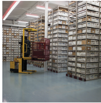
CDSA, Ville de Québec