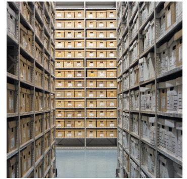
CDSA, Ville de Québec