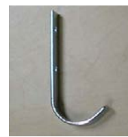
CROCHET FO-53 HOOK