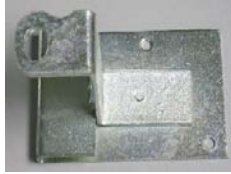
MORAILLON FO-21 HASP