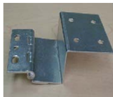
CHARNIÈRE bout-de-série AO-32 HINGE end-of-series