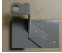
MORAILLON FO-22 HASP