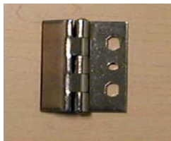
CHARNIÈRE AO-30 HINGE