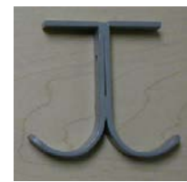
CROCHET FO-54 HOOK