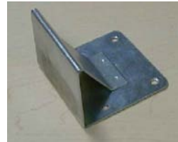
BUTOIR FB-27 STOPPER