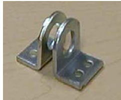
PÊNE À CADENAS FO-24 BOLT WITH LOCK