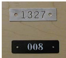
PLAQUES NUMÉROTÉES 033 NUMBERING PLATES