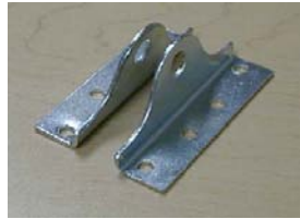
PÊNE À CADENAS FO-25 BOLT WITH LOCK