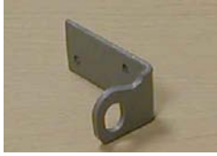
MORAILLON FO-20 HASP