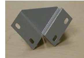
BUTOIR FB-28 STOPPER