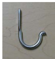
CROCHET FO-52 HOOK