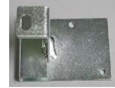
MORAILLON PERFIX FO-93 PERFIX HASP