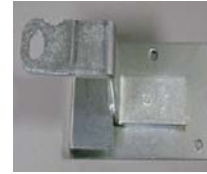
MORAILLON FO-89 HASP