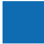
Bleu Avalanche 055