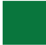
Vert Nature Lustré 1025