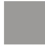
Gris Moderne 745