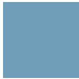
Bleu Everest 051

AVOIR LA POSSIBILITÉ DE PERSONNALISER VOTRE PRODUIT ROUSSEAU AVEC L'UNE DE NOS VINGT COULEURS STANDARDS, C'EST AUSSI ÇA, LA DIFFÉRENCE ROUSSEAU!