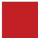
Rouge Carmine Lustré 806