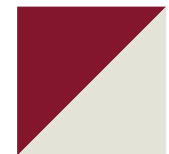
Rouge Canneberge Lustré/ Blanc Givre 815/061