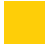
Jaune Lustré 208