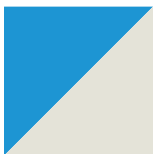
Bleu Classique/ Blanc Givre 052/061

POUR ENCORE PLUS DE DISTINCTION, COMBINEZ DEUX OU PLUSIEURS COULEURS. VOICI QUELQUES EXEMPLES :