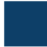
Bleu Minuit 057