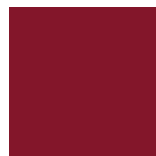
Rouge Canneberge Lustré 815