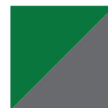
Vert Nature Lustré/ Gris Charbon 1025/072