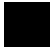
Noir Lustré 902

POUR ENCORE PLUS DE DISTINCTION, COMBINEZ DEUX OU PLUSIEURS COULEURS. VOICI QUELQUES EXEMPLES :