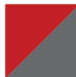
Rouge Carmine Lustré/ Gris Charbon 806/072