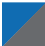
Bleu Avalanche/ Gris Charbon 055/072