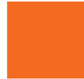
Orange Sienna 085